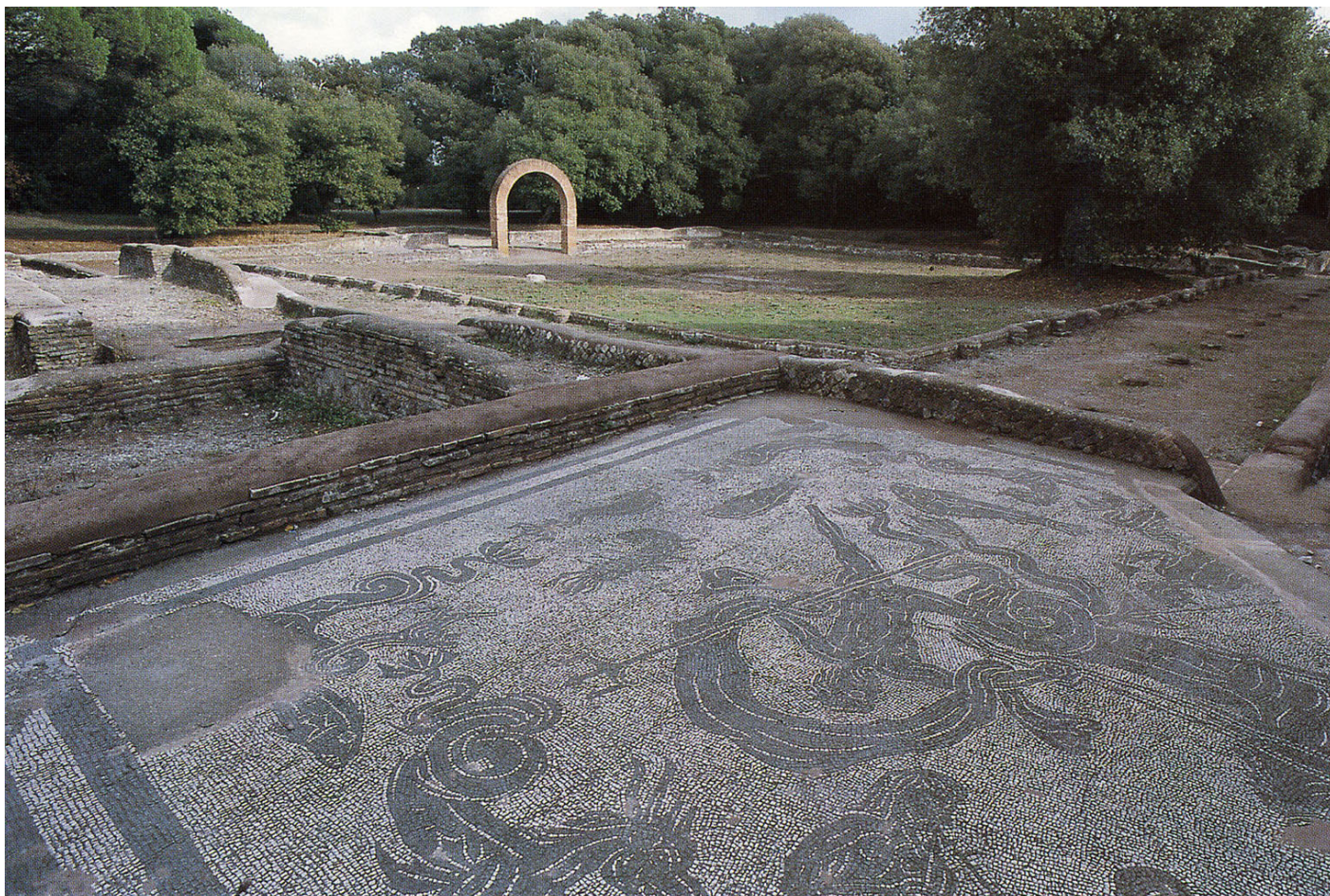
Fig. 2. Vedute del quadriportico con particolare del mosaico delle terme.