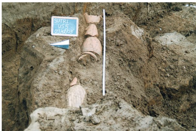
Fig. 3. La canalizzazione monumentale in tufo.

Sulla superficie dei basoli si vedono ancora le tracce di usura dovute al passaggio dei carri. La strada registra una discreta pendenza salendo da est verso ovest ove si interrompe bruscamente, come dimostrano sia i basoli che gli umbones sparsi nel terreno: difficile dire se questo sconvolgimento sia stato causato dalla