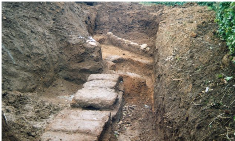
Fig. 2. Particolare dello strato di drenaggio con anfore.

La struttura monumentale in tufo, USM 11 (fig. 2), individuata nel corso dei lavori degli anni '90, è identificabile con un'infrastruttura idraulica; è costituita da due muri paralleli in blocchi di tufo più o meno regolarmente sagomati, aventi uno spessore medio di cm 0.43 e distanti tra loro cm 0.58, messi in opera a secco per un'altezza di ca. cm 140. I due muri sono coperti da grossi lastroni di tufo di forma rettangolare e dimensioni abbastanza regolari, cm 130x0.60, disposti perpendicolarmente ai muri stessi. Tra i due muri uno strato di riempimento, US 13 solo parzialmente scavato, che ha restituito pochi frammenti ceramici, tra cui un frammento di parete di vernice nera che, seppure non diagnostico, permette di inquadrare l'abbandono della struttura intorno al III/II secolo a.C. Questo tipo di canalizzazione monumentale rientra in una tipologia poco nota di cui il territorio etrusco, comunque, fornisce analoghi esempi: un tratto di canalizzazione simile, per altro di notevole estensione, è stato documentato a Tarquinia in località Gabelletta 1 e lungo la Braccianese presso la località Osteria Nuova 2 .