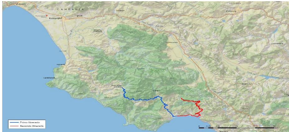
Figura 7: Itinerari turistici nel Cilento.

digitalizzazione, dunque, come strumento di sostenibilità, soprattutto per quei contesti come il Cilento, nei quali possono essere ipotizzati diversi itinerari, supportati da una piattaforma digitale che agevoli sia le istituzioni nella pianificazione dello sviluppo, sia i visitatori in termini di mobilità, ospitalità e servizi di vario tipo.