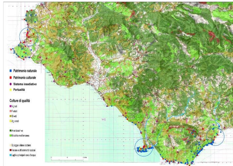
Figura 1: Le risorse territoriali del Parco Nazionale del Cilento Vallo di Diano e Alburni.

insediativo al quale, tuttavia, non corrisponde una adeguata infrastrutturazione funzionale.