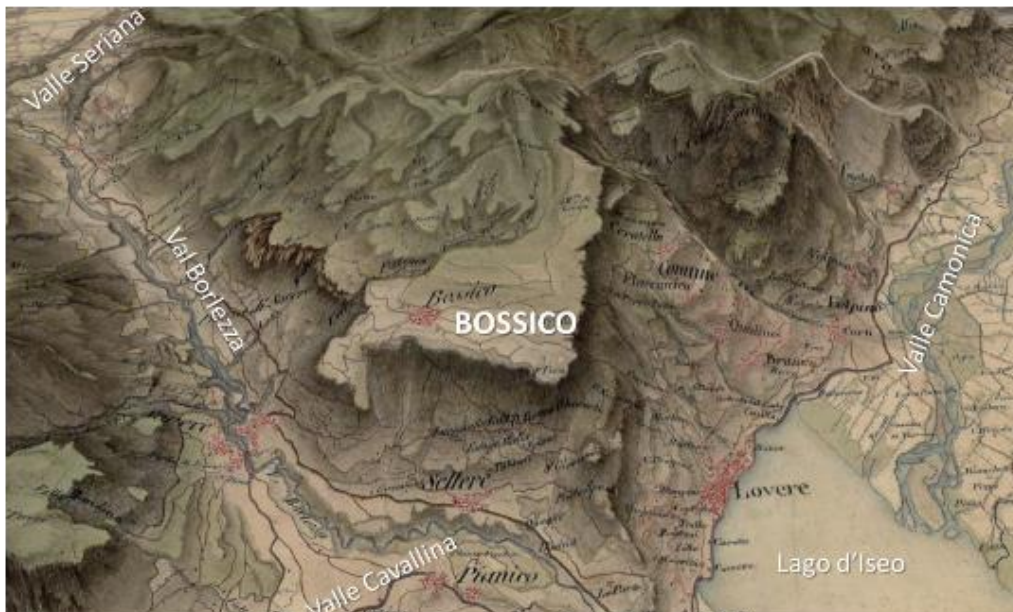
Figura 1: Localizzazione del territorio di Bossico in posizione strategica e dominante il Lago d'Iseo

In linea con le indicazioni della Convenzione Europea del Paesaggio, la ricerca condotta a Bossico ha avuto l'obiettivo di analizzare le potenzialità del paesaggio per prospettare una valorizzazione progressiva ma integrata delle sue risorse, a partire dalla scala locale, per poter identificare nel futuro una reticolarità esterna, sia regionale, con le valli e i territori limitrofi a cui si lega storicamente (Val Cavallina, Val Borlezza, Sebino, Valle Camonica), sia internazionale mediante l'attivazione di un progetto di sviluppo turistico che intercetti a scala europea uno dei territori del network europeo Centralità dei territori (Casti, Burini, 2015).