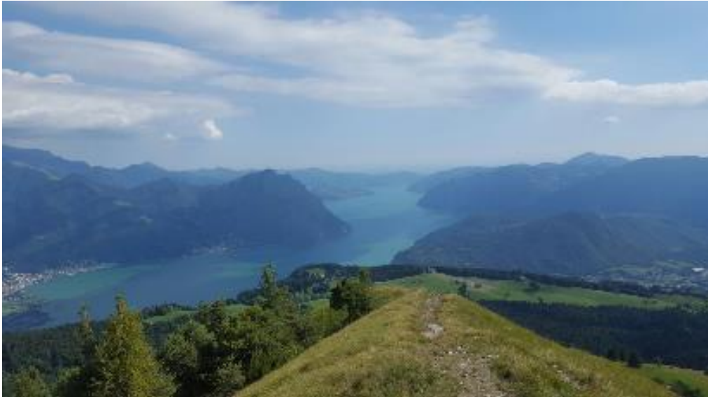
Figura 2: Il paesaggio lacustre dalla cima del Monte Colombina