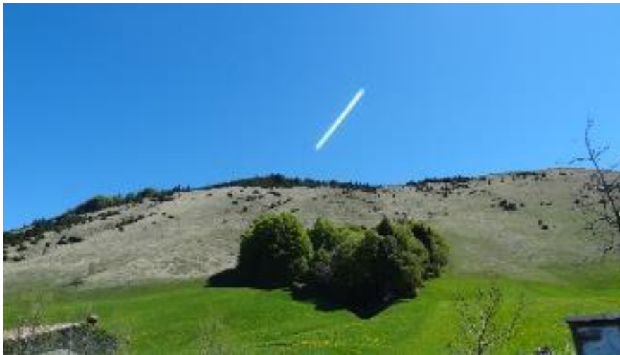
Figura 3: La dolina situata alle pendici del Monte Colombina

da diverse depressioni chiuse come le doline e le valli morte. Vi si trovano infatti numerose doline determinate da un processo chimico operato dall'acqua sulle rocce calcaree che permettono il rapido smaltimento delle acque di precipitazione e favoriscono la totale scomparsa dell'idrografia superficiale che viene sostituita da un'idrografia profonda, fino agli strati impermeabili che le costringono a tornare all'esterno sotto forma di sorgenti come avviene in prossimità del torrente Borlezza.