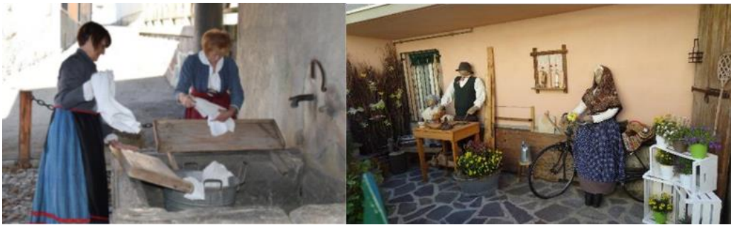
Figura 6: Immagini presenti nel percorso virtuale: l'antico lavatoio ed esterno di una casa privata che espone oggetti e strumenti di lavoro legati ai saperi rurali di Bossico

Il tour creato, e denominato “Bossico, saperi e sapori”, vuole operare come lente tematica in cui si vuole offrire al visitatore, oltre che una visione generale del borgo, un approfondimento specifico riguardante i saperi territoriali presenti in questi luoghi, stimolando una loro tutela e valorizzazione coinvolgendo direttamente la sensibilità e l'interpretazione attiva del turista che fruirà dei contenuti. Esso si snoda all'interno del borgo di Bossico, posto sull'altopiano più basso del paese e cerca di connettere i principali iconemi e luoghi ritenuti rilevanti dalla comunità locale, poiché ben esprimono sia la bellezza del paesaggio naturale, che la profondità dei saperi culturali locali.