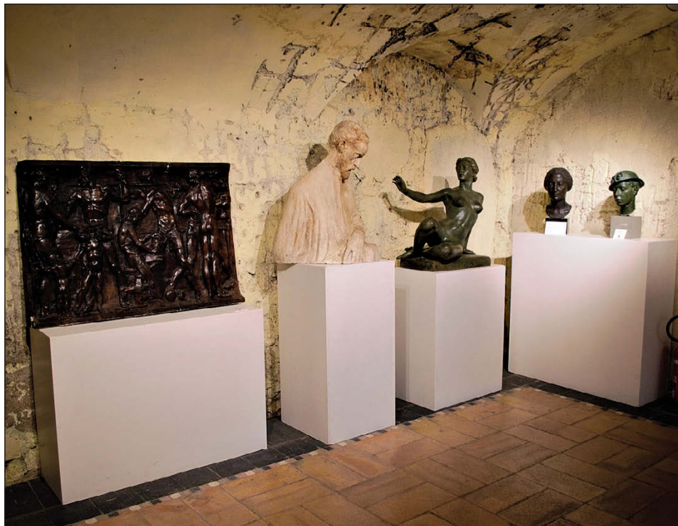
Fig. 1 – Sala delle Carceri del Civico Museo d’Arte Moderna e Contemporanea di Anticoli Corrado, da Wikimedia Commons (foto R. Manzollino).

I contenuti sono facili da gestire e condividere, gli strumenti sono gratuiti e gestiti dalla piattaforma: si può così dedicare maggiore attenzione all’argomento e creare molti collegamenti con una comunità internazionale (ALBORE et al. 2021).