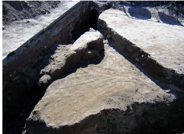
Fig. 4. A sinistra la struttura muraria in opera listata.

La stratificazione geologica e archeologica d'età antica è infine tagliata per la realizzazione del piazzale antistante la basilica di Onorio III (1216-1227). L'area doveva essere compresa entro le fortificazioni di Laurentiopolis (XII-XIII secolo), il cui muro di recinzione occidentale rimase in elevato fino alla prima metà del XVII secolo. Il piazzale ricevette una prima sistemazione monumentale nel 1704 9 .