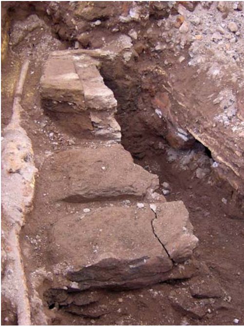
Fig. 2. La cava a cielo aperto.