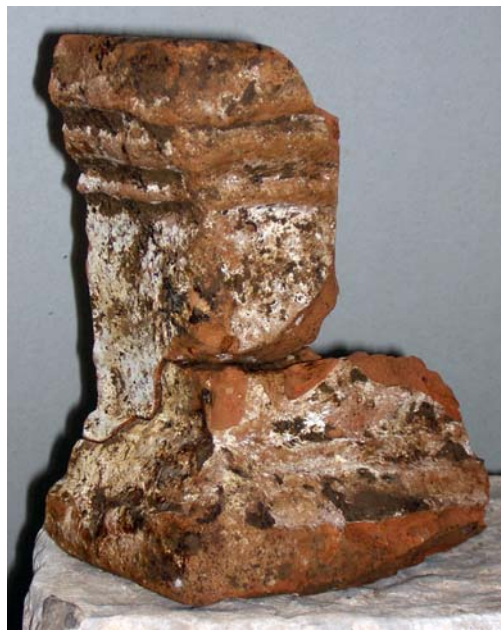
Fig. 3. L'arula fittile parzialmente ricostruita.

anfore Late Roman Amphoras 2 di produzione egea e Keay LII per il vino bruzio) che ne circoscrive il terminus post quem agli anni 440/450-500/525 d.C. (scodella Hayes 84) 7 , restituisce una placca d'osso decorata a linee incise e "occhi di dado" da accessorio di toilette o coperchio di cofanetto ligneo 8 e due frustoli epigrafici, uno dei quali recante parte di formula calendariale.