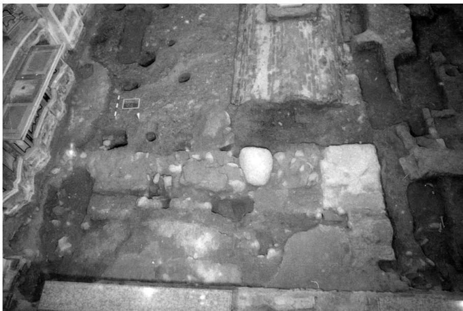
Fig. 2. Veduta generale: in primo piano le fondazioni attribuibili alla prima fase della chiesa e buche dei pali per le impalcature.

le ossa. Entrambi sono stati deposti con cranio a sud e probabilmente con il viso rivolto verso l'altare. L'inumato situato ad est si presenta disteso, con il bacino leggermente spostato, la gamba sinistra ripiegata verso la destra, distesa lungo la parete della cripta; la parte inferiore del corpo è coperta da lembi di tessuto nero, piuttosto spesso, che è stato lasciato in posto. Lo scheletro ad ovest, disteso, è stato deposto con il braccio destro ripiegato all'altezza del torace. La parte inferiore del corpo, a ridosso dell'altro inumato, presenta la gamba destra sovrapposta e ripiegata sulla sinistra. La posizione di alcune ossa della mano suggerisce che il braccio sinistro sia stato disteso lungo il fianco. Non si esclude la possibilità che i due inumati siano stati deposti in momenti differenti: lo scheletro ad ovest appare infatti "disturbato", forse