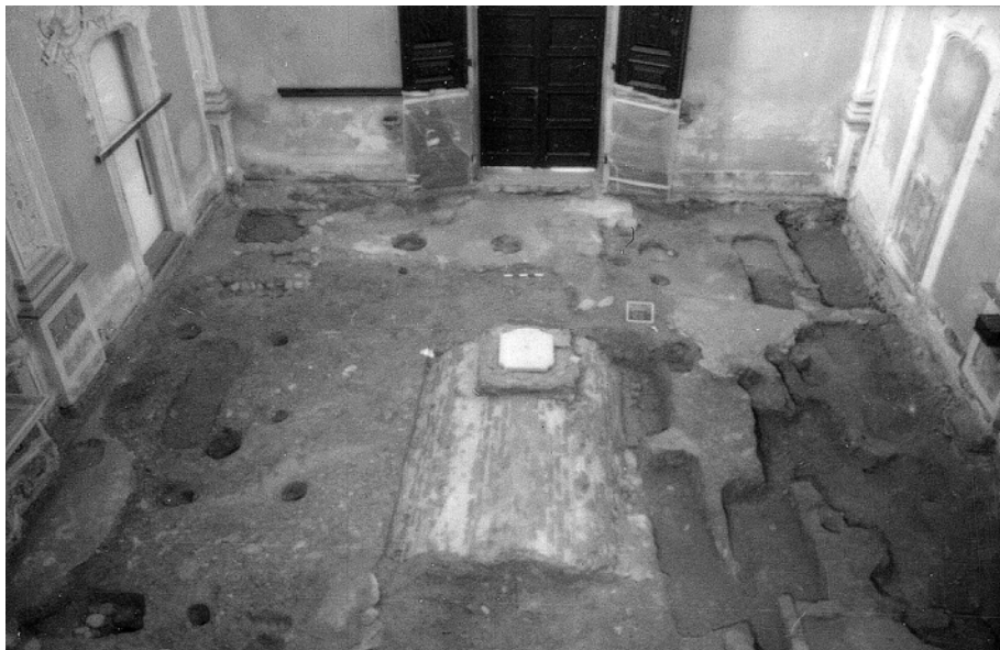
Fig. 4. Veduta generale dello scavo, al centro la volta della cripta centrale.

anch'essa inglobante grossi ciottoli. Il raccordo fra questi due bracci avviene, ad ovest, tramite un rinforzo angolare o base di pilastro, delle dimensioni di m 1,20 x 0,90. Quest'ultimo, pur realizzato con materiali edilizi pressappoco identici a quelli già descritti, ha un legante leggermente diverso, di colore biancastro. Un ultimo braccio si sviluppa a NE del braccio N-S: è stato possibile documentarlo solo parzialmente poiché in parte coperto dalla balaustra di recinzione dell'altare. Esso misura m 0,50 in senso N-S e m 0,60 in senso E-W. Ad ovest risulta asportato dal taglio della tomba 1. La tecnica edilizia è identica a quella documentata negli altri bracci del muro. Verso sud, in corrispondenza dell'attuale ingresso della chiesa, è stato rinvenuto un piccolo lacerto conservato anch'esso a livello di fondazione, molto simile per tecnica edilizia a US 9 e in linea con il suo braccio N-S. È stato possibile misurarlo per m 0,60 N-S (ma continua sotto il muro perimetrale sud della chiesa) x m 0,94 in senso E-W.