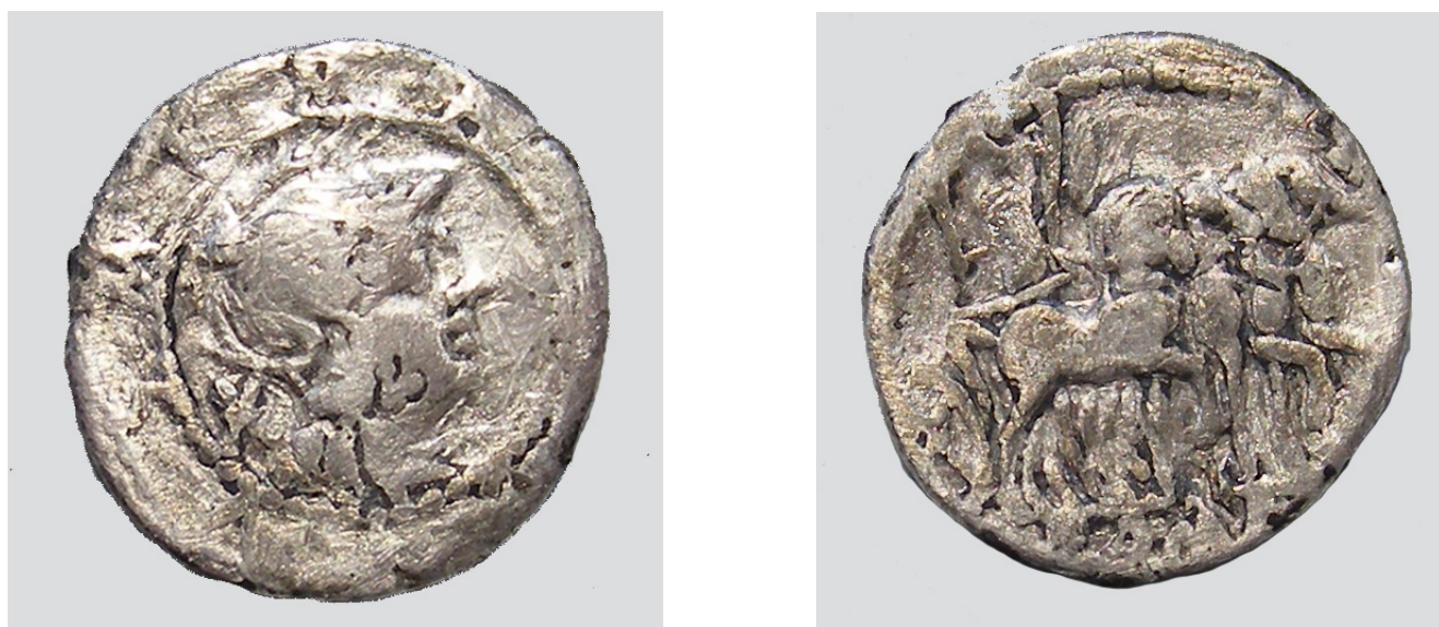
Fig. 5. Denario repubblicano.