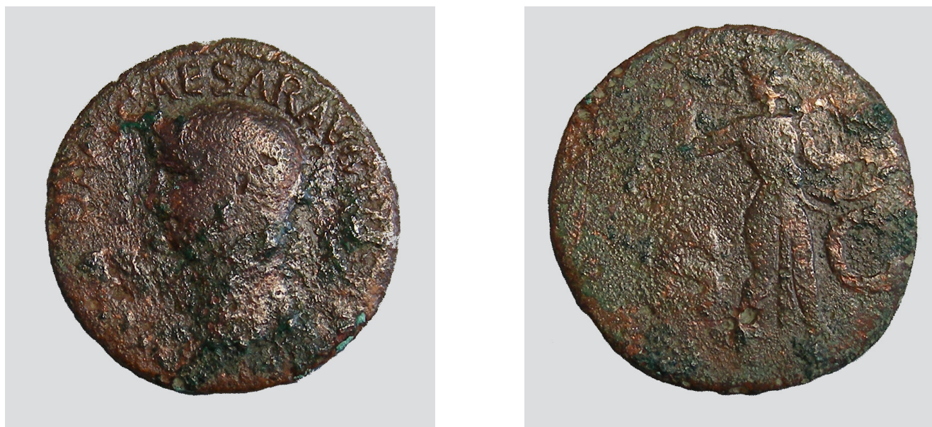
Fig. 4. Asse di Claudio.