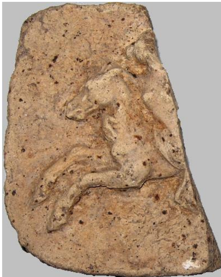
Fig. 7. Pinax con nereide su ippocampo.

perlata appena accennata 12 . Una quinta testina, in pessimo stato di conservazione, mostra appena visibili i tratti somatici del volto incorniciato da uno spesso cercine tubolare 13 .