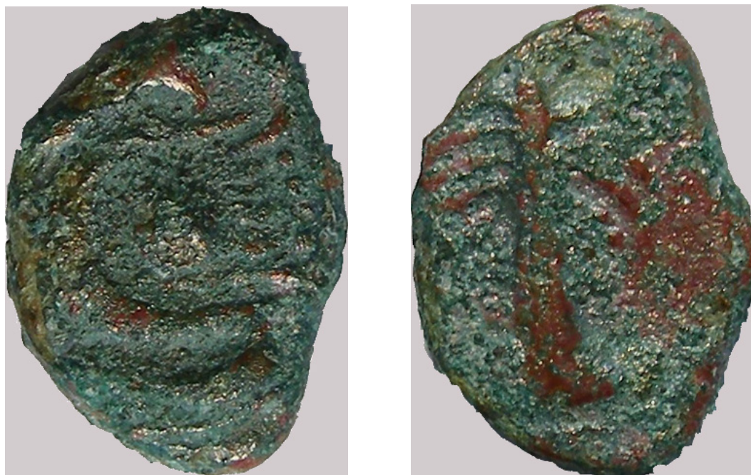
Fig. 6. Moneta di Baria.

vescio una palma con frutti (fig. 6). Questo è il secondo esemplare di bronzo rinvenuto a Pompei 8 . La cronologia per la moneta di Baria è compresa tra la fine del III secolo a.C. e la metà del II secolo a.C. La provenienza di queste monete rispecchierebbe le rotte commerciali del Mediterraneo Occidentale che mettono in contatto l'area campana con la penisola iberica.