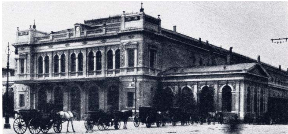
La stazione di Trieste in una foto di fine Ottocento.

Le stazioni medio-piccole, impostate su un modello unico su tutto il territorio nazionale, hanno formato un linguaggio visivo comune. Le stazioni delle grandi città, concepite come