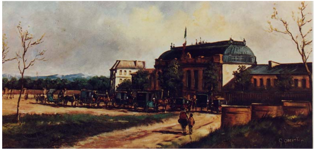
La vecchia stazione di Milano.

La galleria del Moncenisio, lunga 12.819 metri, venne inaugurata il 17 settembre 1871. In appena 40 km il tracciato saliva dai 440 m di Bussoleno ai 1.259 di Bardonecchia e ai 1.296 del confine italo-francese in galleria.