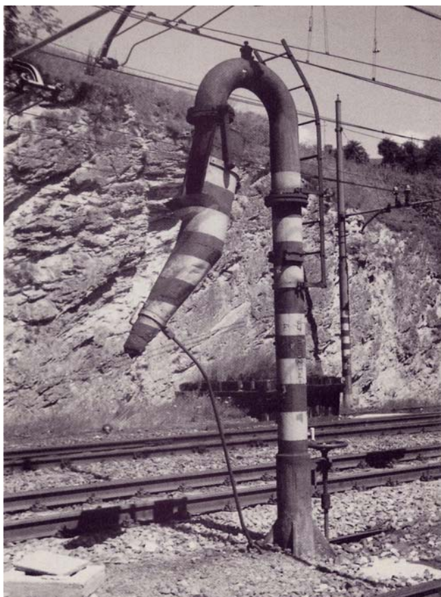
Vipiteno, colonna idraulica dell'800.

il governo continuò ad esercitare la sorveglianza per mezzo dell'Ispettorato Generale delle Ferrovie). Vennero costruite nuove linee, fra le quali la Napoli-Battipaglia-Reggio Calabria e la succursale dei Giovi. Nel 1899 venne inaugurato il servizio di traghetto ferroviario sullo Stretto di Messina. Nello stesso anno, a Torino, veniva fondata la Fabbrica Italiana Automobili Torino: il nuovo secolo avrebbe segnato l'avvio e il progressivo sviluppo della circolazione degli autoveicoli e lo sviluppo delle arterie stradali. Dal 1888 al 1896, in coincidenza con la generale depressione economica, le costruzioni ferroviarie progredirono molto lentamente, anche perché il capitale privato si rivolgeva ormai preferibilmente all'industria. Del resto la grande rete di collegamento era ormai compiuta e restavano da realizzare solo le linee del meridione, dove l'utile di esercizio era assai basso. Nel 1890, tuttavia, si ebbe un'importante novità nel campo dei trasporti pubblici: l'impiego dell'energia elettrica come forma motrice. Sperimentata in Germania, l'applicazione dei motori elettrici alla trazione meccanica venne introdotta, nel 1890, in un servizio tranviario tra Firenze e Fiesole. Altre linee tranviarie entrarono in funzione, negli anni successivi, in alcune città di grandi dimensioni come Genova, Milano e Roma. Lo sviluppo dei servizi tranviari stimolò l'introduzione della trazione elettrica nel campo ferroviario, una tecnica che avrebbe avuto grande espansione.