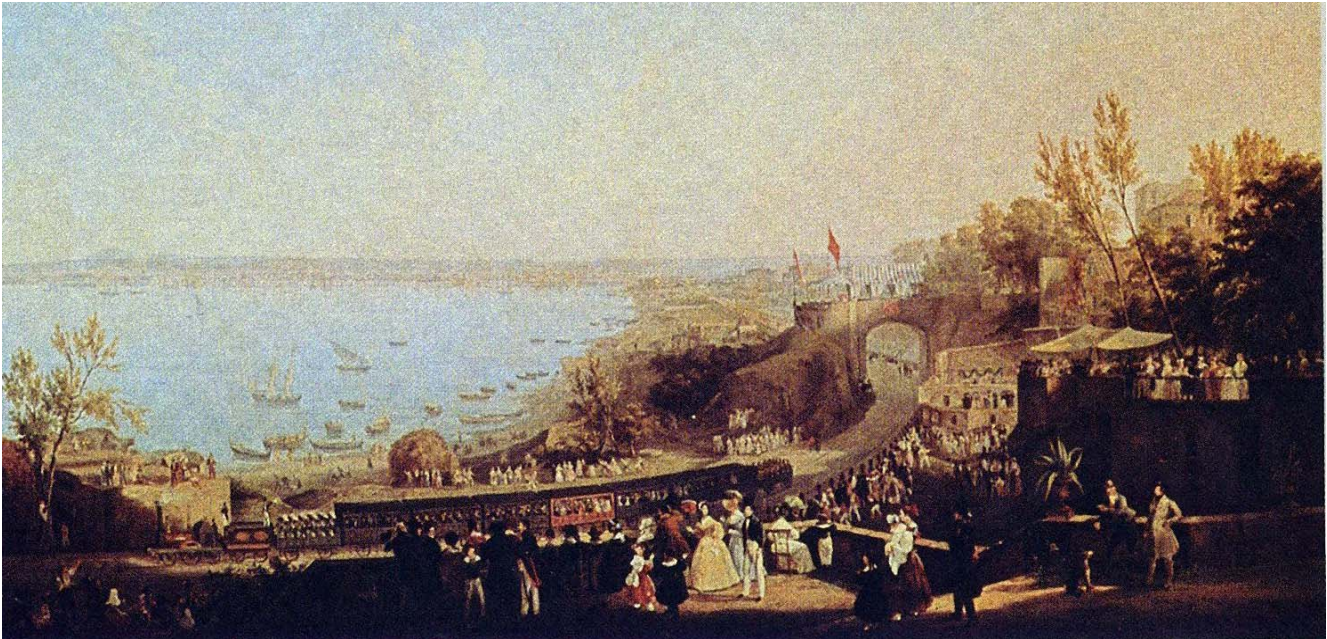
L'inaugurazione della Napoli-Portici in un dipinto di Salvatore Fergola.

vano iniziato a svilupparsi le prime grandi strade ferrate, l'Austria aveva compreso molto presto le potenzialità insite nel nuovo mezzo di comunicazione e aveva progettato una serie di collegamenti ritenuti fondamentali.