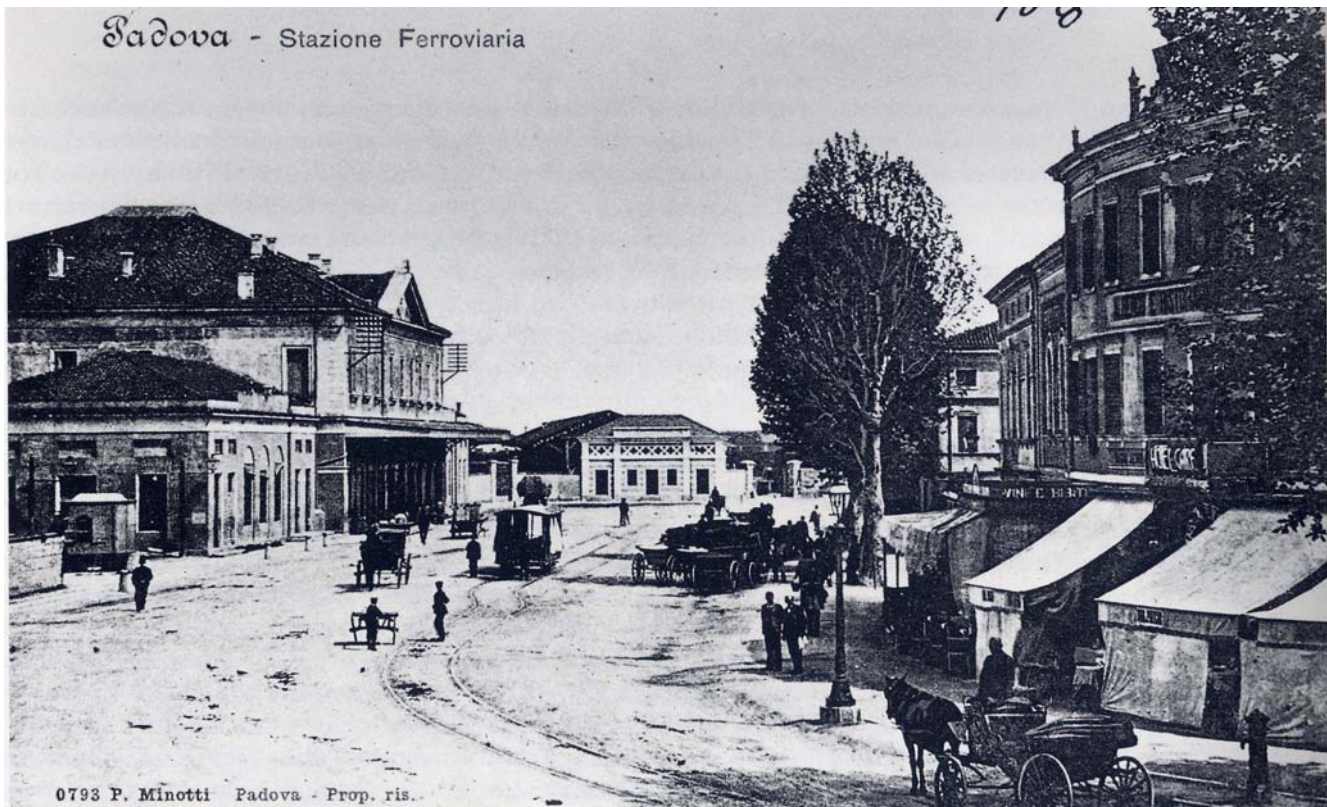
La prima stazione di Padova in una veduta fotografica.

compiere le linee normali sulle quali si possa attirare il commercio estero". Cominciarono a sorgere gruppi di azionisti che cercavano investimenti finanziari in attività redditizie. Alla fine del 1861 il territorio politicamente italiano era attraversato da 2.560 km di ferrovie, la maggior parte delle quali era localizzata nell'area padana (ma non tutte le linee erano ben costruite).