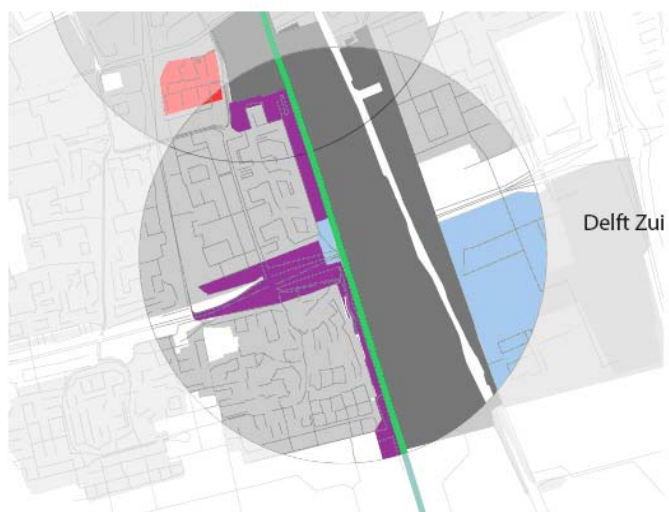
4.09 Delft Zuid

Inoltre la mancanza di un coordinamento nella fase decisionale ed una eventuale non corrispondenza tra i piani di trasporto ed i piani urbanistici può comportare che le scelte legate alla costruzione o riqualificazione di una stazione indirizzino le scelte per il territorio e non viceversa. In altre parole si rischia che gli interventi sul sistema di trasporto, a volte non facenti parte di un piano unitario e soprattutto più facilmente finanziabili rispetto ad opere di trasformazione