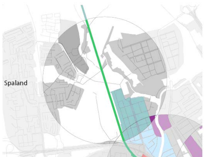
4.10 Schiedam Kethel