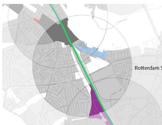
5.05 Rotterdam Stadion