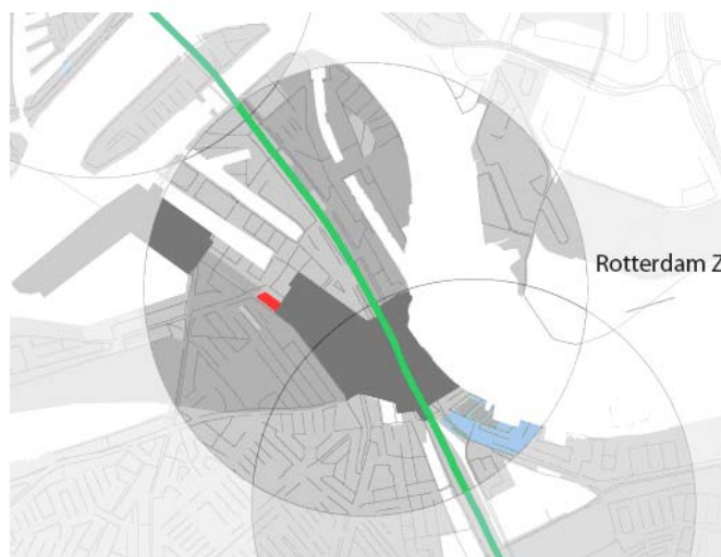
5.03 Rotterdam Zuid