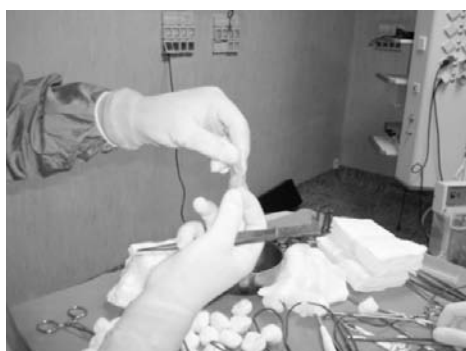
Fig. 1 - Preparazione del plug (Surgisis® a sinistra; TissueDura® a destra).