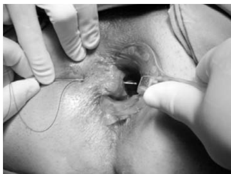
Fig. 2 - Tragitto fistoloso trans-sfinterico semplice.