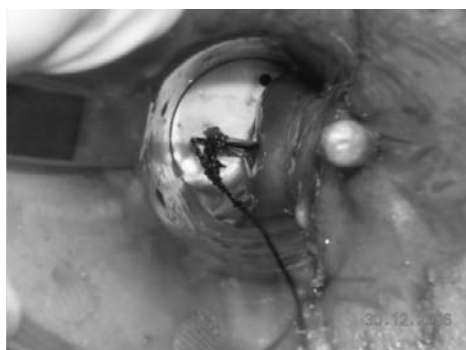
Fig. 3 - Introduzione del plug (Surgisis® a sinistra; TissueDura® a destra).